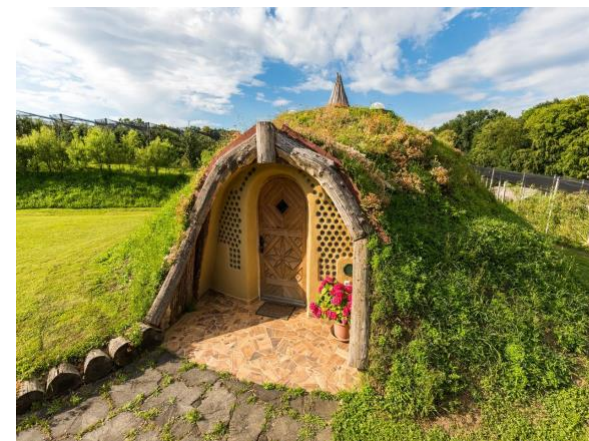
Tipična hiška škratkov

Za vse to pa je potrebno nekaj samodiscipline in kulturnega obnašanja. “Razgrajače” bomo opozorili in poslali varnostni sms staršem. Oratorij bomo zaključili v četrtek, 29.6. ob 16h s sv. Mašo. Vabimo mamice in druge dobre ljudi, da za ta dan za naše otroke pripravijo sladka presenečenja po maši. Otroci pa bodo pokazali svoje umetnine, ki so jih izdelovali v delavnicah.