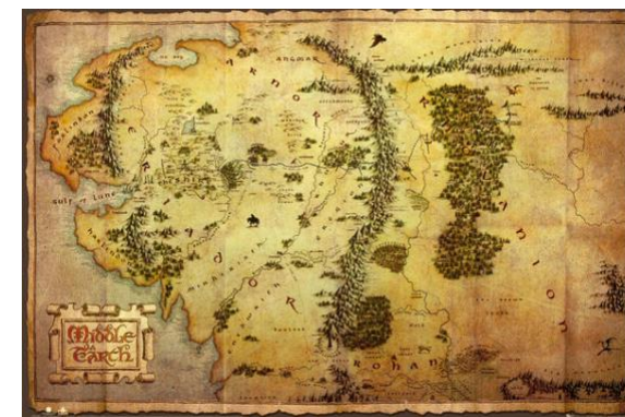
Šajerska – dežela Hobitov

Avtorjev cilj je bil torej ustvariti samostojen domišljjski svet, ki pa bi bil lahko tudi mitološka predzgodovina resničnega sveta. Vendar pa je po svojih lastnih besedah napisal “seveda v temelju religiozno in katoliško delo” , saj drugačnega kot katoličan niti ne bi mogel.