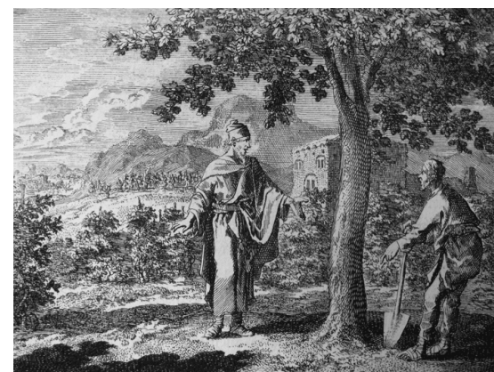
apud philip medhuust THE PARABLE OF THE FIG TREE. LUKE 13:6-9 JAN LUYKEN excudit: harry kossuth